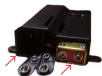
緊急バッテリーケースのサイドから乾電池2本をセットします。

*緊急時に緊急バッテリーケースを使用するには、9V角型乾電池2個（別売り）が必要です。ただし、通常使用時、リモコン設定時は電池は必要ありません。*