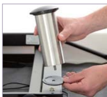
※写真のレッグはイメージです。